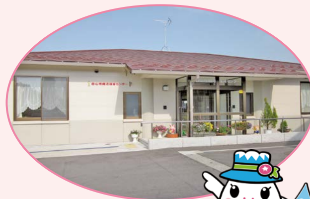
白山手取川ジオパークイメージキャラクター 「ゆきママとしずくちゃん」