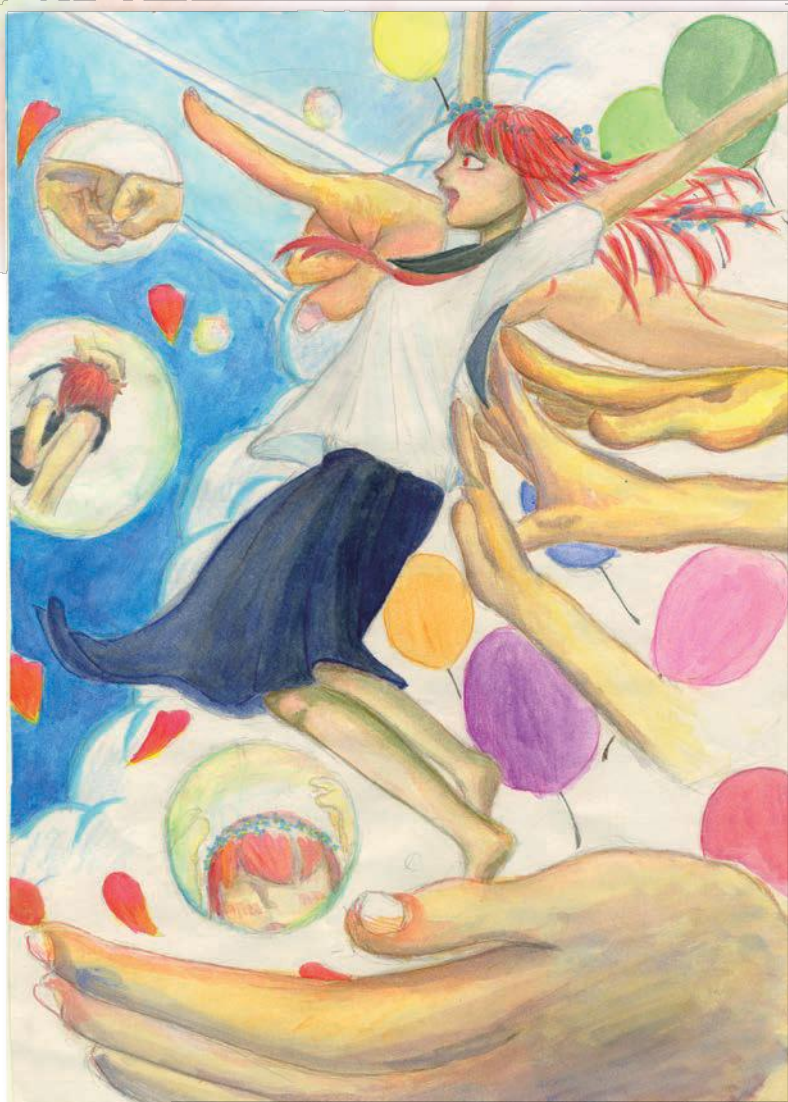
※イラストは、金沢高校美術部員による作品です。

▲JR松任駅or北鉄バス:「松任」下車徒歩数分 できるだけ公共交通機関をご利用ください。