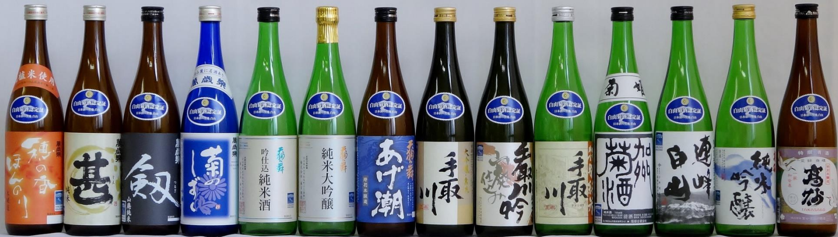
白山菊酒とあさがおお盃