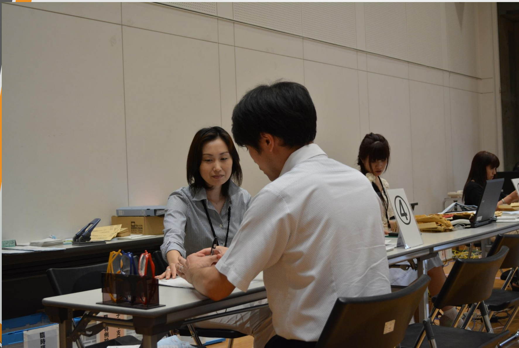
市民交流センターに設置した臨時窓口