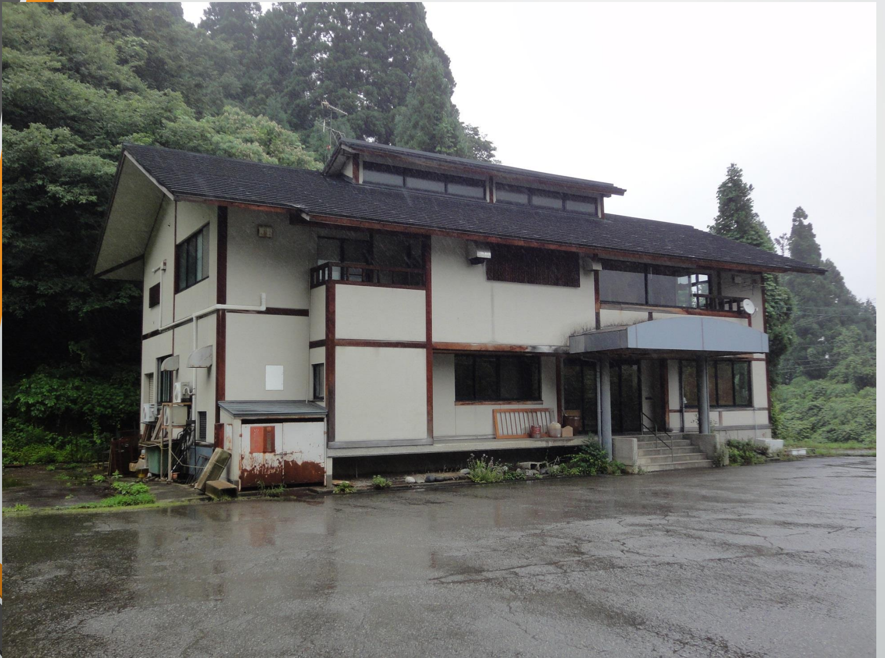
改修される尾口山菜加工施設