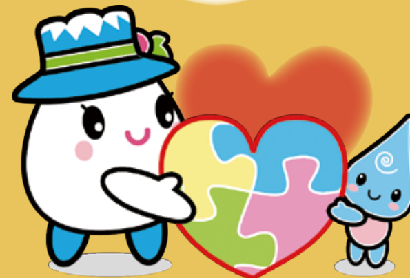
白山手取川ジオパークイメージキャラクター ゆきママとしずくちゃん

白山市発達相談センターでは、幼児期から学齢期、成人期までの一人一人の発達状況に応じた相談や支援を行います。