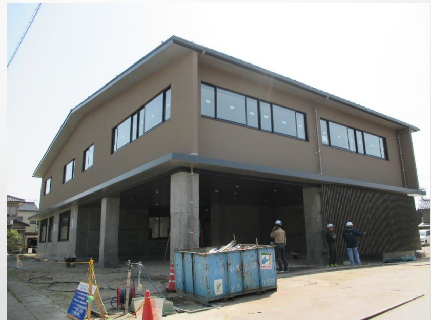
▲地域交流センター「よろーさ」外観