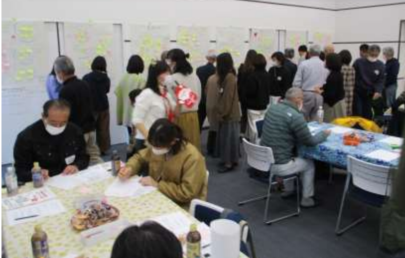
グループ発表の投票