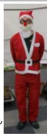
サンタさんも参加