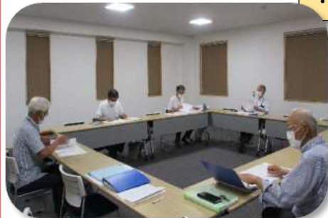
検討会メンバー6名