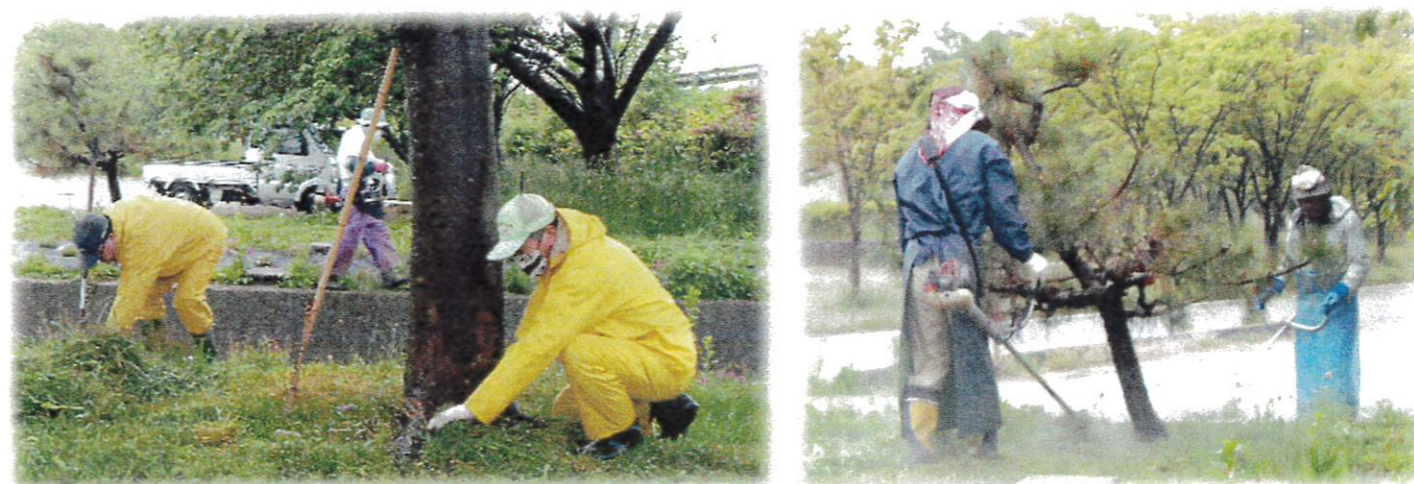
5月14日(土) 芝桜の除草作業の様子