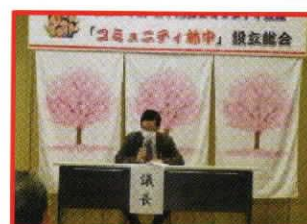
《議案審議：永岡議長》