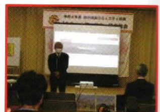
《閉会挨拶：西村副会長》