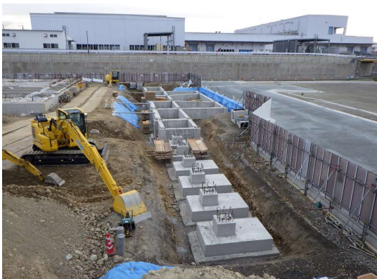
手前：車寄せ屋根の基礎 奥：バリアフリー駐車場屋根の基礎 コンクリートを打設し、 型枠を取り外しました。