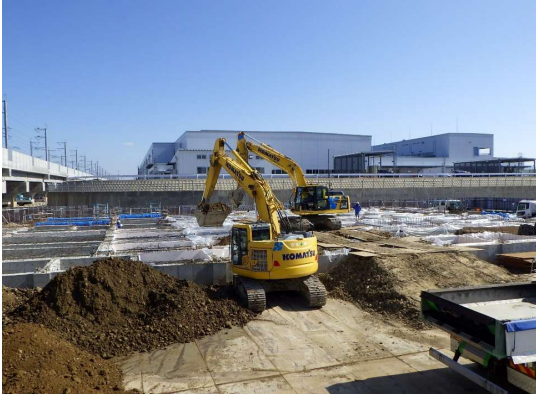
建物（室内部分相当）の基礎コンクリートを埋め戻しました。