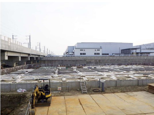
建物（室内部分相当）の 基礎コンクリートの埋め戻しが完了しました。 4月上旬からいよいよ柱を建てていきます。