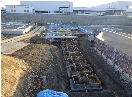
手前：車寄せ屋根 奥：バリアフリー駐車場 基礎型枠、配筋を行いました。