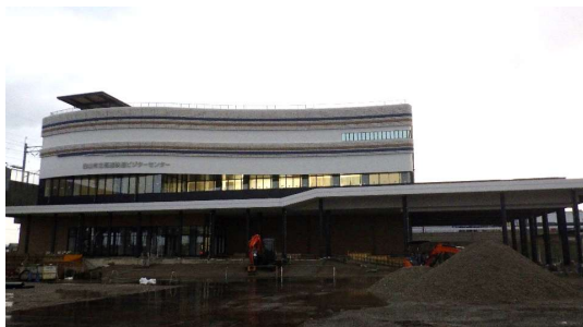
外部足場が解体されました。 外構工事を進めています。