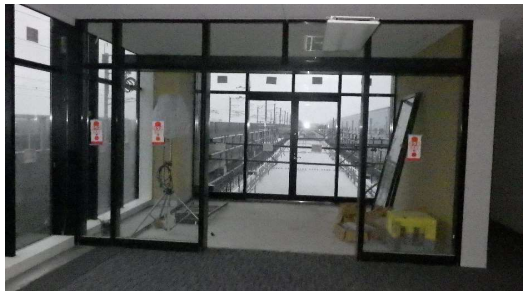
4階展望室と白山総合車両所内に設ける 見学デッキを結ぶ橋の工事が進んでいます。 新幹線がすぐ横を疾走していく姿を見られる 絶好のビューポイントの一つです。