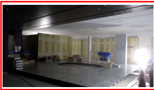
1階鉄道展示の内装工事を 進めています。 凹凸を設けた特徴的な壁面が 現れてきました。