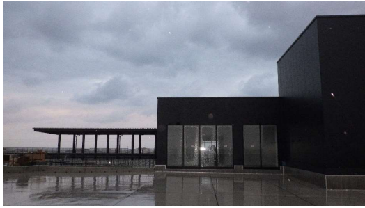
5階の展望室は、天井壁床が仕上がり、 設備工事が進んでいます。