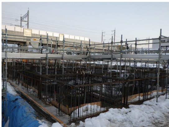
ラップルコンクリートの埋め戻しを行い、地中梁のコンクリート打設に向けて配筋を行っています。(B-1工区)