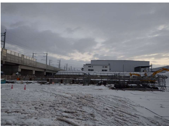
雪に覆われた現場ですが、工事は進みます。