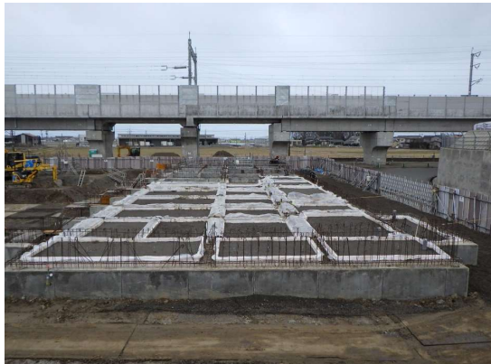
地中梁の埋め戻しを行いました。(A工区)