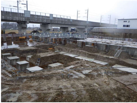
ラップルコンクリートを打設しました。(B-1工区)