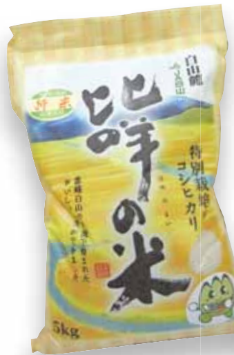
特別栽培米 比咩の米