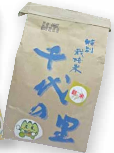
特別栽培米 千代の里