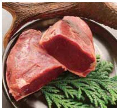
白山ろくのジビエ