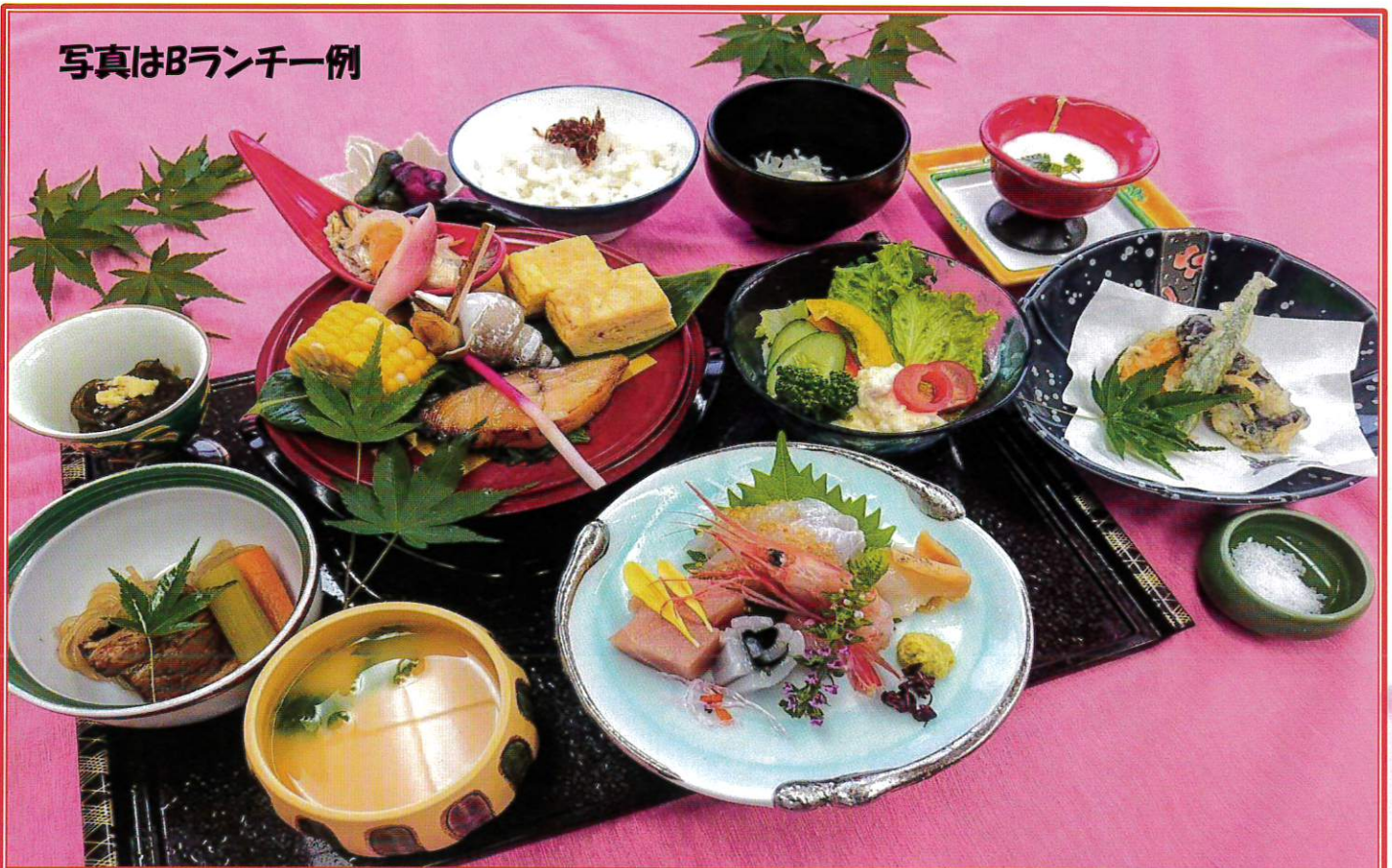
写真はBランチ一例

白山市相木町151-1 (松任駅北口徒歩2分) TEL 076-275-1871