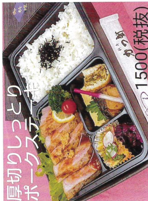
厚切りしっとり ポークステーキ