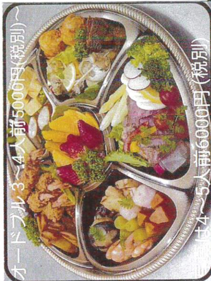
オーードブル3~4人前5000円(税別)~