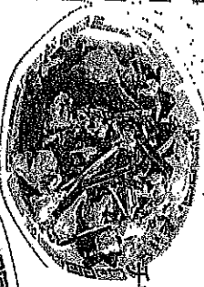
チヤージューニラ