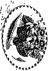
チヤージューニラ