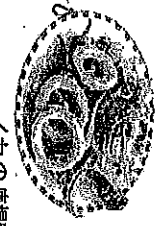
チヤージューニラ