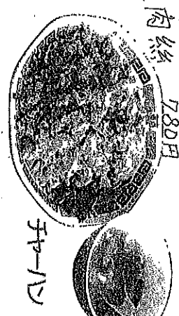
チヤージューニラ