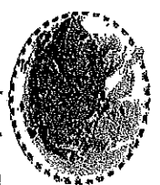
チヤージューニラ