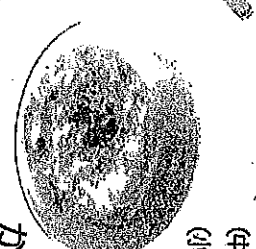
チヤージューニラ