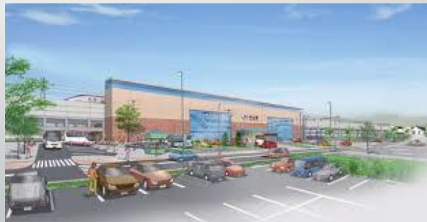
(仮称)白山駅整備イメージ