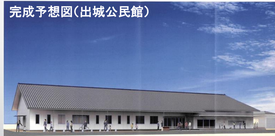
完成予想図（出城公民館）

全公民館を対象に精査し、今後のスケジュールなどのシミュレーションを実施するほか、新たな計画を策定する。