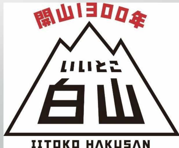
白山開山1300年記念ロゴ