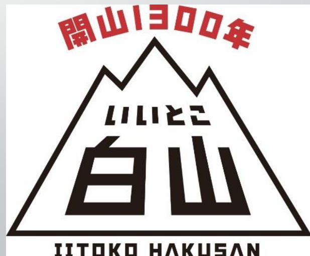
白山開山1300年記念ロゴ