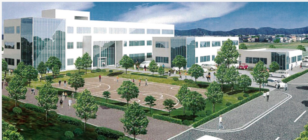
(仮称)金沢専門職大学イメージ

特産品を使った商品開発のほか、不登校児のサポートや子供向けの職業体験などを予定。