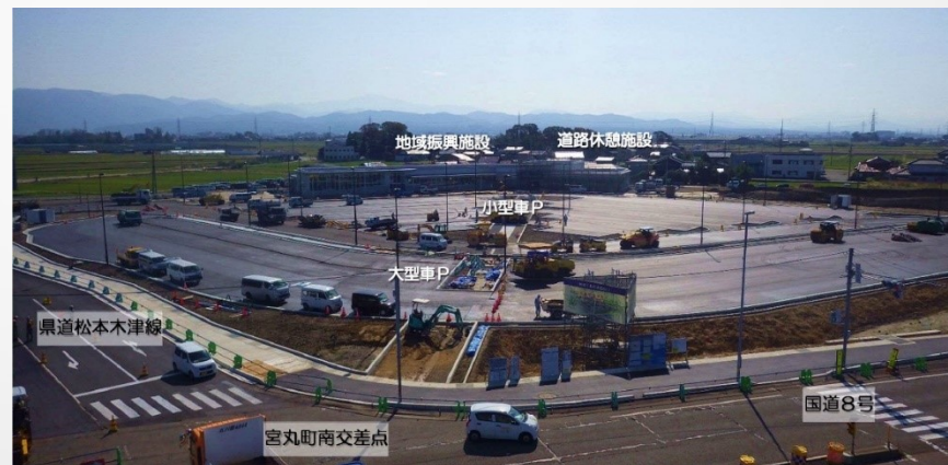
「道の駅めぐみ白山」現在の工事状況

また、渋滞対策として、7月から国道8号の小松方面からの右折レーンを延長する工事を行っている。