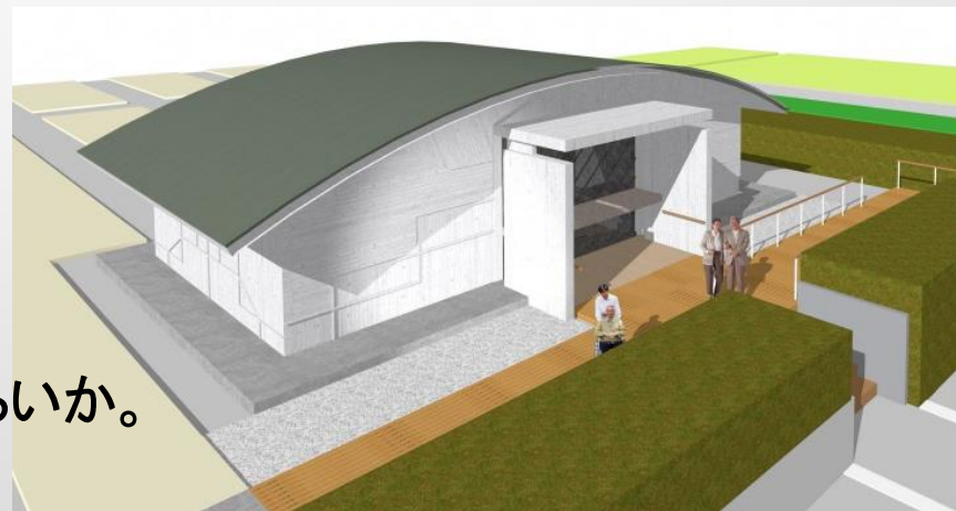
合葬墓 イメージ図