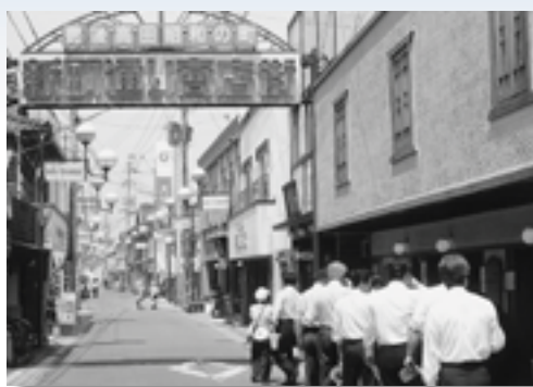
活性化した「昭和の町」

5月30日から6月1日にかけて、福岡県宮若市、大分県豊後高田市、福岡県八女市及び久留米市を視察しました。