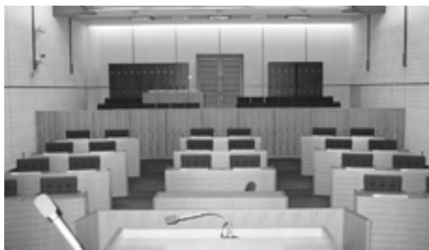
備蓄庫として検討される旧議場