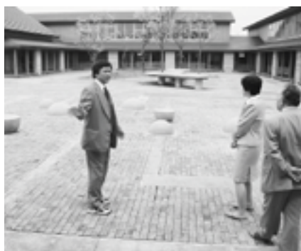
視察先の学校校舎

白山市においても、山ろくでの統合小・中学校の建設計画もあり、特に冬季における暖房、雪害対策を考える上で参考になる点が多くありました。