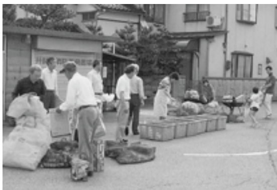
子供も参加資源ゴミ収集

質問 コミの減量化は次世代にツケを残さず、環境に優しい社会創りと共に、ゴミ処理費用の減少が税金の無駄を無くすることに。もなる。ゴミ処理費用の負担割合をゴミの量に比例させることが大切であり、市民の理解と協力が得られ易い方法だと考えるがどうか。