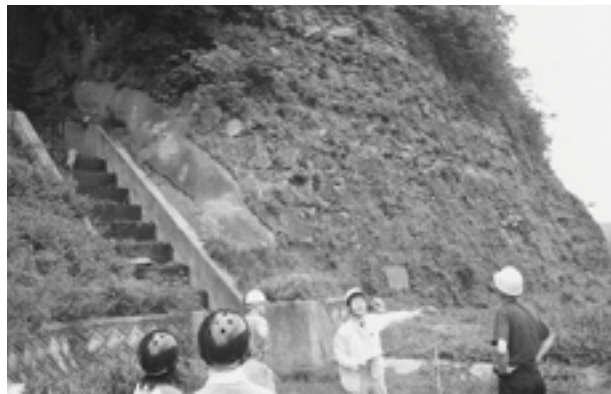
化石壁の下で学習する「化石調査隊」