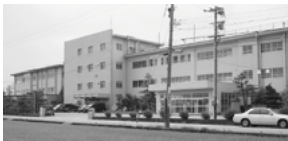
改築予定の松南小学校

市長 緊急通報システムの内容の充実、普及に努める。また、障害者や高齢者の世帯に安心して生活できるように設置個数の措置と貸与を検討する。