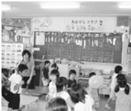
新設が待たれる広陽小学校の放課後児童クラブ