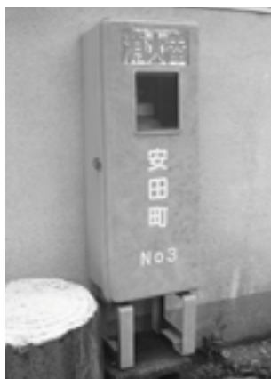
街頭に設置されている消火器。

健康福祉部長 ①吉野谷診療所に新設したい。今後もし制度については導入に向けて検討する。