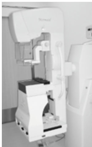
つるぎ病院にマンモグラフィ