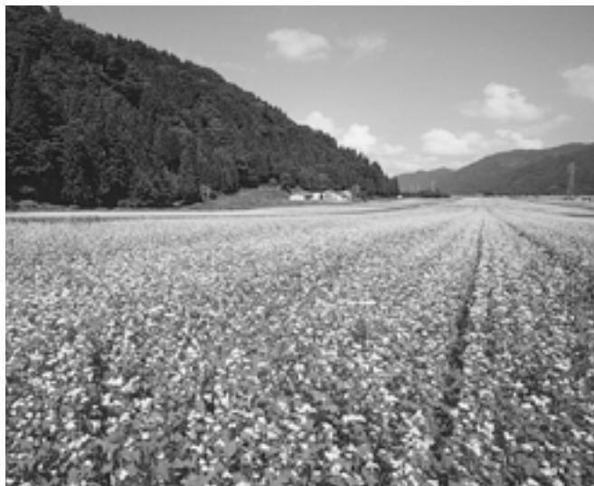
地域作物(鳥越地域)そば

市長 平成19年度から品目横断的経営安定対策が導入されている。本市として振興作物が品目により対象から外れた品目があるが、米施策改革推進対策における新産地づくり対策、いわゆる主要な転作物の中で取り組みがないか、国の動向を見きわめながら、JAとともに特性を生かした地域振興作物の推進に積極的に取り組む。