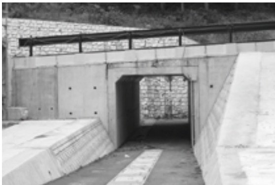
地下道となった道路

【答え】ゆずりレーンの一車線が増えたため、佐良地内と農地等が国道で分断されるので、安全のため横断地下道を新設。