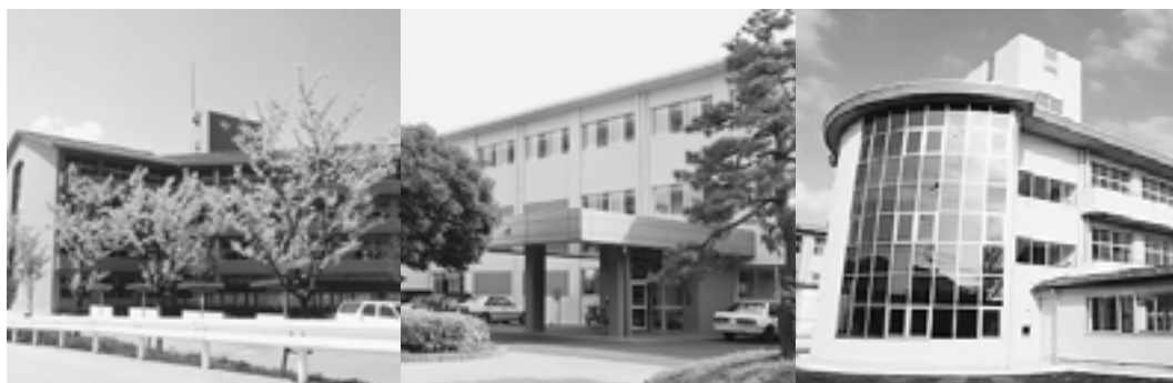
市内の公立高校(左から鶴来高校、翠星高校、松任高校)

県教育委員会が年度内に新たな指針を策定し、来年度中に次期高校再編整備案を計画しており、提案については県に働きかけていきたい。