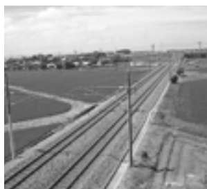
北陸線に沿って新幹線の引き込み線が