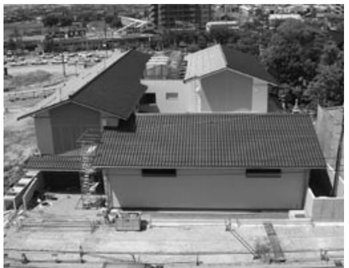
建設中の千代女の里俳句館