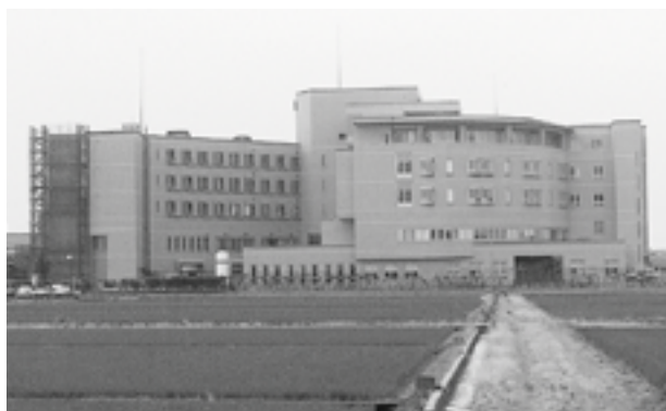
地域医療の要、公立松任石川中央病院

市長 今後、病院倫理委員会などで、改めて延命治療を含めた終末期医療についての判断を考えていく。