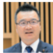
中野 進 議員