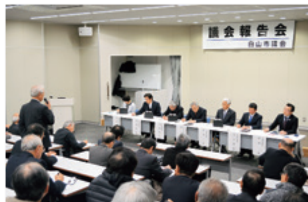
福祉ふれあいセンターで開催

防災行政無線個別受信機については、美川地域と白山ろく地域への配備は完了している。松任、鶴来地域は実施設計に入り、個別受信機を順次導入する予定をしている。