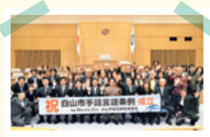
白山市聴覚障害者協会と議場にて