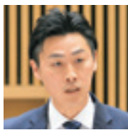
池元 勝 議員