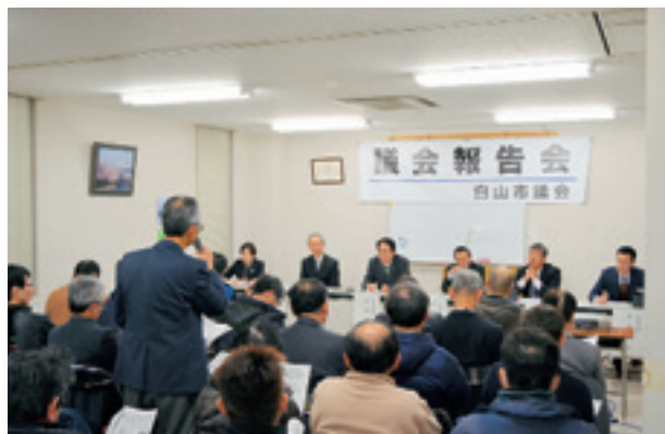
一木公民館で開催

沿線町会とも協議しながら、グリーンベルトの設置を含め、歩行者などの安全対策について検討していきたい。