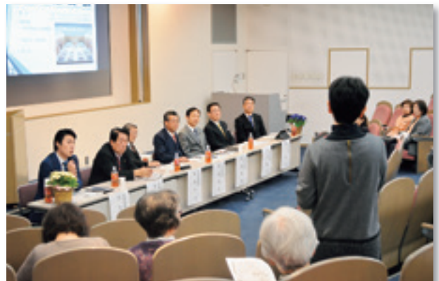
市民交流センターで開催

森本富樫地震を想定した避難者、約2,200人が3日間、暮らしていけるよう確保している。今後、ホームページにも掲載することを検討したい。