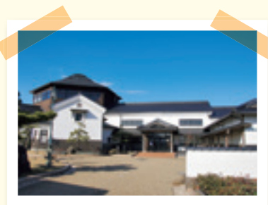
石川ルーツ交流館

答え 伏流水汲み場については研修室近くのものには再整備するが、正面玄関のものは予定はない。また、町内会等で研修室を使用する際の飲食については、今までどおりできないと考えている。