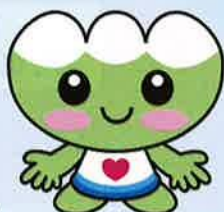
白山市社協マスコット キャラクター「ふくちゃん」