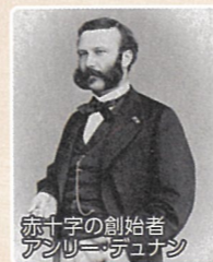
赤十字の創始者 アンリー・デュナン

赤十字の創始者であるアンリー・デュナンは、1859年6月イタリア統一戦争の激戦地ソルフェリーノの近くを通りかかり、「傷ついた兵士はもはや兵士ではない、人間である。人間同士としてその尊い生命は救われなければならない」との信念のもとに救護活動にあたりました。その「いのちを守る」想いは、今も赤十字活動の根幹となっております。