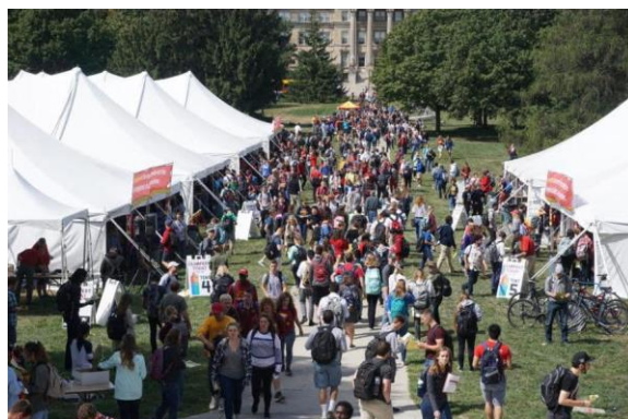
▲アイオワ州立大学のクラブ・フェスト