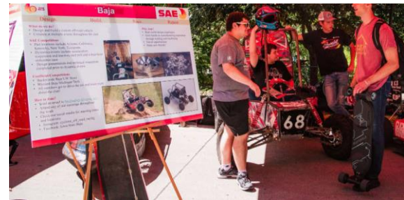
▲ An engineering club's booth at ClubFest