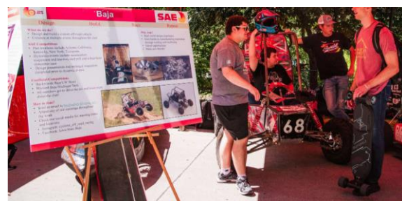
▲クラブ・フェストでのエンジニアリング・クラブのブース