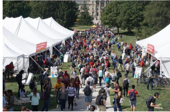
▲ Iowa State University ClubFest