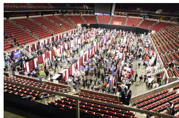
▲ Iowa State University engineering career fair