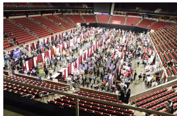
▲アイオワ州立大学のキャリア・フェア