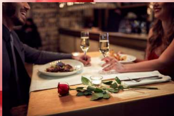
▲ A couple having a romantic dinner to celebrate Valentine's Day