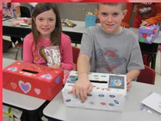
▲ Children exchanging valentines in elementary school