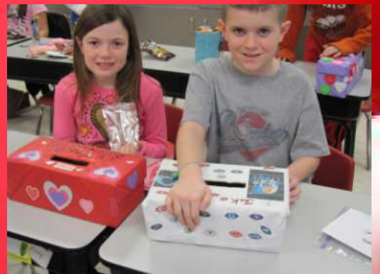
▲小学校で子供たちがバレンタイン・カードやお菓子を交換します。