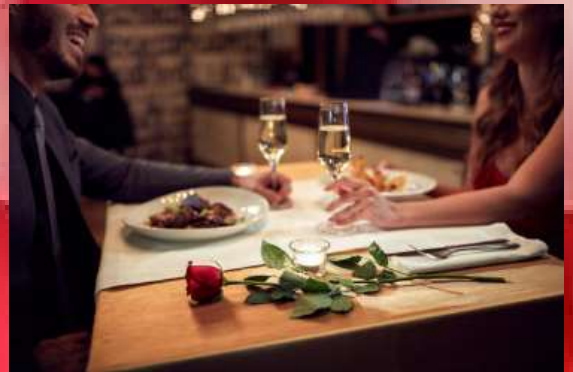
▲バレンタインデーを祝ってロマンチックな食事をするカップルです。