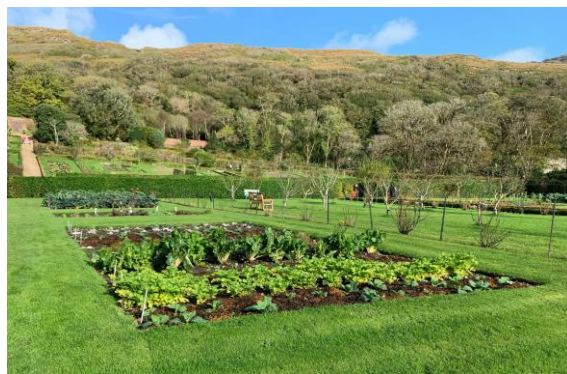
▲ Home Garden