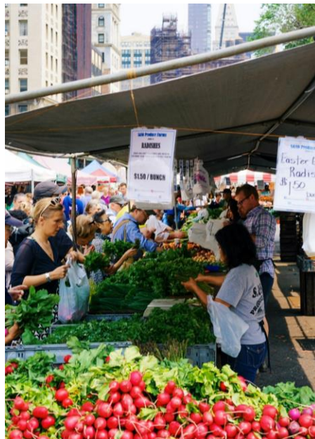
▲ Farmers Market