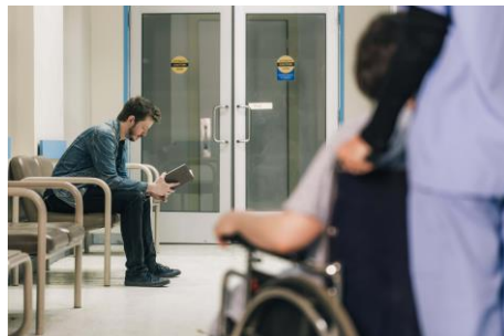
▲病院の待合スペース