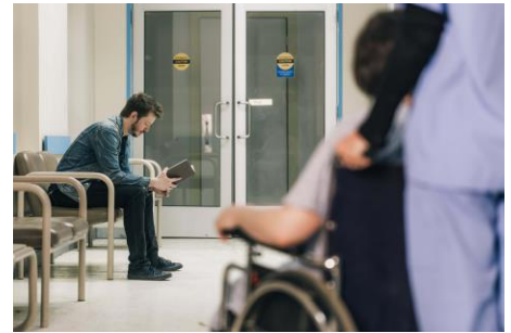
▲ Waiting Area in a Hospital