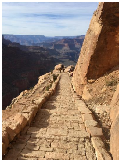
▲グランドキャニオン国立公園