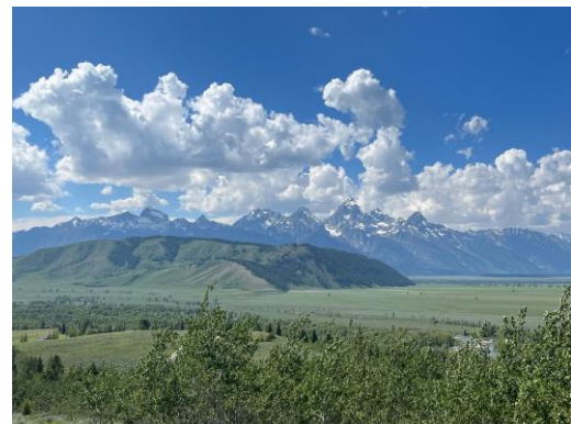
▲ Grand Teton National Park