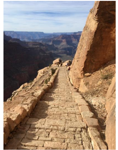
▲ Grand Canyon National Park