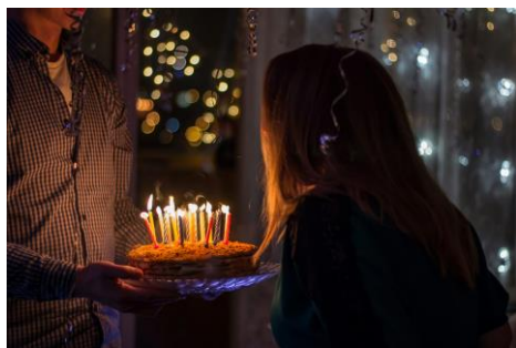
▲誕生日ケーキのキャンドルを吹き消す