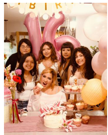
▲ Sweet Sixteen Birthday Party