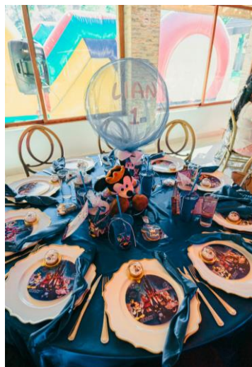
▲ディズニーテーマの誕生日パーティー