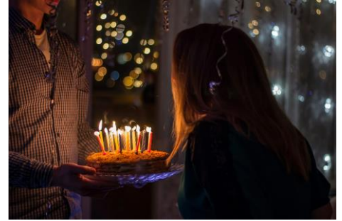
▲ Blowing Out Candles on a Birthday Cake