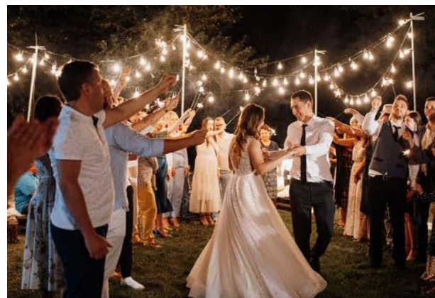
▲ First dance between bride and groom at the reception