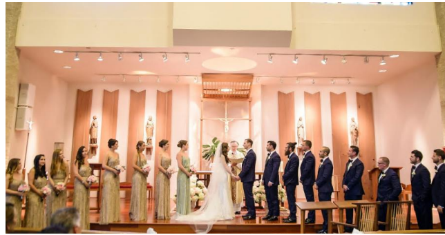
▲ Wedding Party = bridesmaids, groomsmen, maid of honor, best man

The wedding starts with the guests arriving, and taking their seats. The processional will start when everyone is seated and the groom and officiant are standing at the altar. The officiant could be a priest, or it could be a friend who got ordained to legally marry the couple. The procession starts with bridesmaids and groomsmen who enter and stand on either side of where the bride and groom will stand.