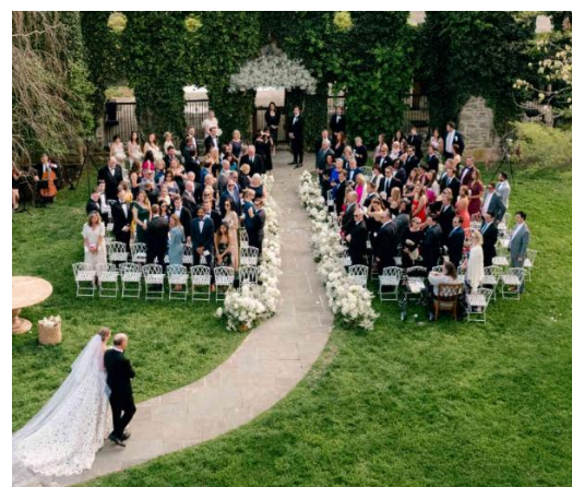
▲屋外会場で、父親が花嫁を式の通路で付き添う入場行進