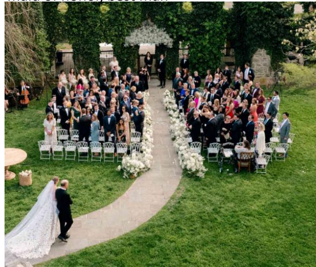
▲ Wedding processional with the father escorting the bride down the aisle at an outdoor venue