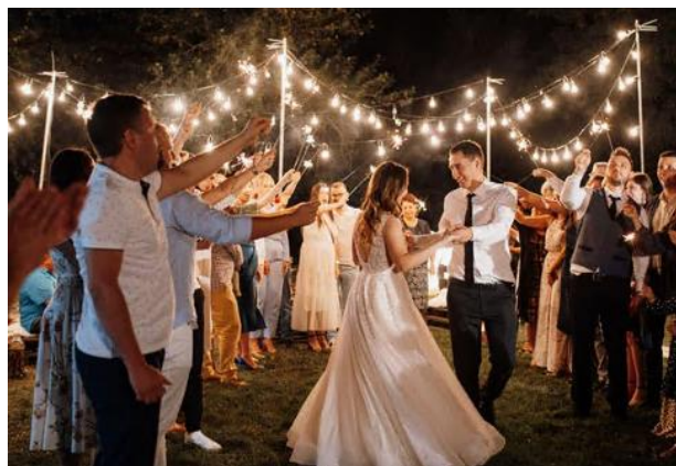
▲披露宴での新郎新婦のファーストダンス