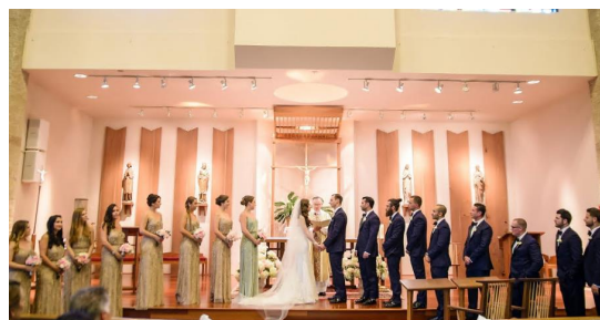
▲Wedding Party = bridesmaids, groomsmen, maid of honor, best manの総称

結婚式は、まずゲストが到着して席に着くところから始まります。全員が着席し、花婿と司式者が結婚式のステージの前に立つと、入場行進が始まります。司式者は神父や牧師の場合もありますが、法的に結婚を執り行えるように認定を受けた友人が務めることもあります。入場行進は、bridesmaids と groomsmen が登場し、それぞれ花嫁と花婿が立つ場所の左右に並ぶところから始まります。