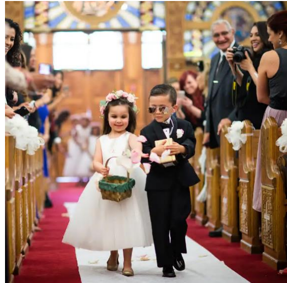
▲ Flower girl and ring bearer