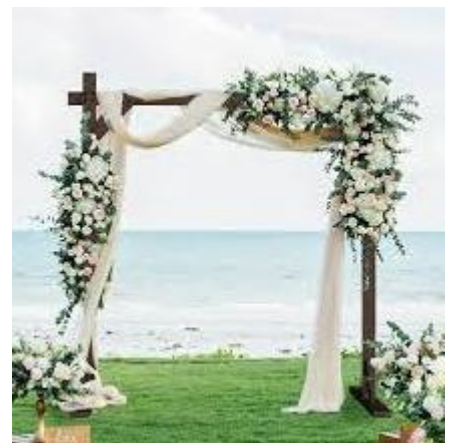
▲ Wedding Arch