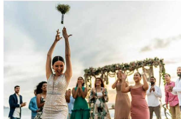
▲ Bouquet toss during the reception. Only single women can participate, and the person who catches it is said to get married next.