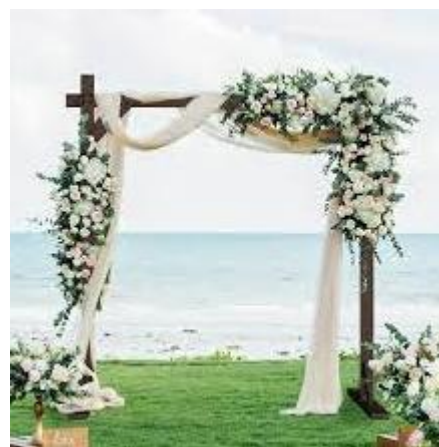
▲ウエディングアーチ