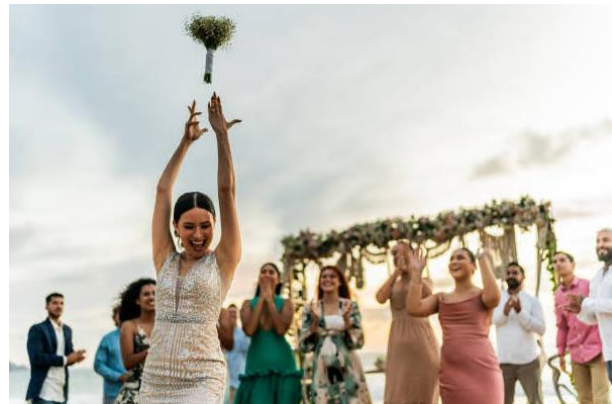
▲披露宴でのブーケトス。参加できるのは未婚の女性のみで、キャッチした人は次に結婚すると言われています。