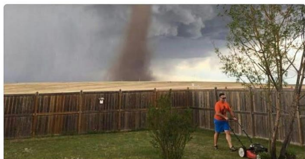
▲ Man who mowed lawn with tornado behind him says he 'was keeping an eye on it'