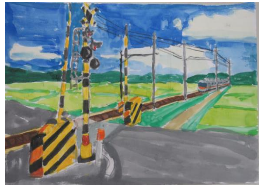
昨年度 最優秀作品

夏の思い出づくりに、Oneコインチケットを使って、 石川線の電車に乗って写生作品を描きませんか？ ご応募お待ちしております！ ^^