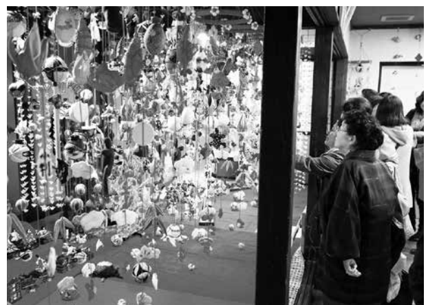
白山美川ふくさげまつり