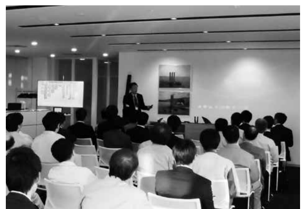
産学官金連携事業