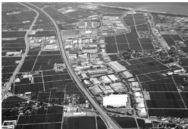
旭・北部・新北部・松任食品加工工業団地