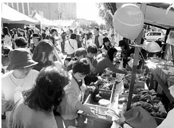
マルシェ・ドゥ・ハクサン