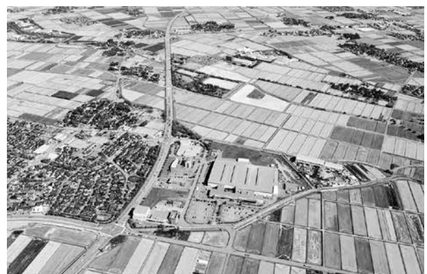
先端技術団地・山島工業団地