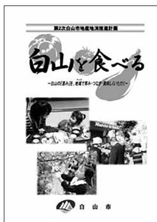
第2次地産地消推進計画