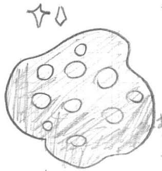
安山岩 あんざんがん

ぼくはいろいろな石をさがしました。ぼくは安山岩は「レア」なものだと思つて、この石を見つけた。うれしかったです。