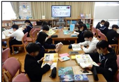
人権を考える本で味見読書

味見読書の後には、使用した本のブックリストの配布や本をブックトラックに集めて展示しておくことで、自分が読んだ本以外のものを手に取れるようにしています。