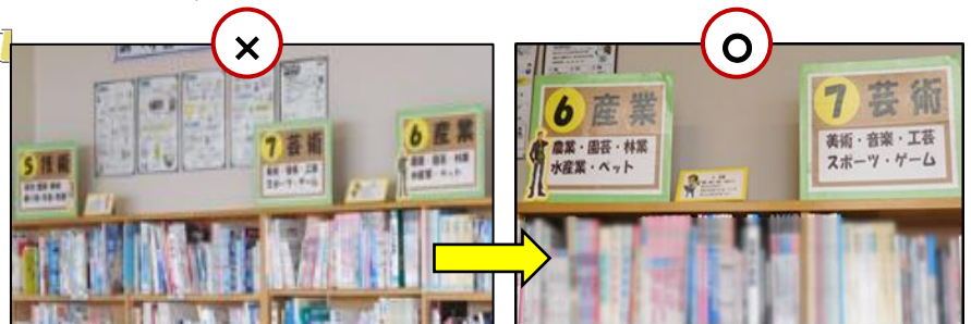
棚の分類表示が間違っている (正 5→6→7)

また、期間の前半と後半で間違いを変えることで、どちらにも参加できるように工夫しました。参加者はもちろん、企画した図書委員も利用規則を確認したり、図書館のマナーを再認識したりする良い機会になっていました。