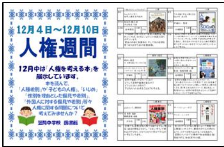
人権を考える本のブックリスト

《人権を考える本》 *机には8から10冊ほど置いてあります *1冊2分の時間を設けない場合は、短時間で読みやすいものを選書しています。