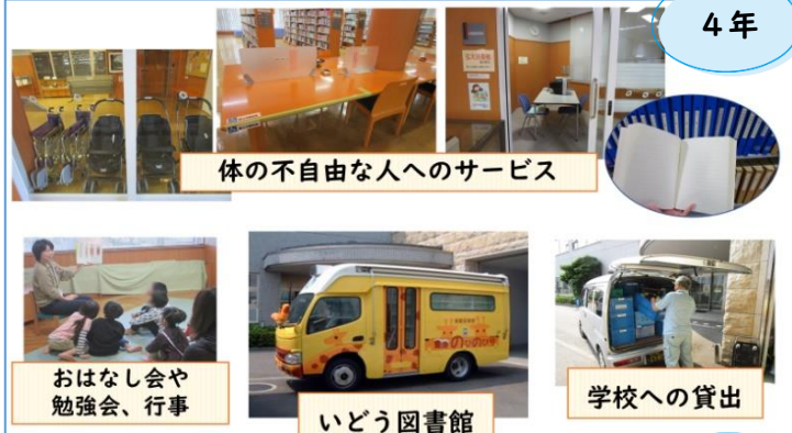
体の不自由な人へのサービス