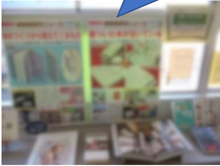
1年道徳「本が泣いています」ブックリスト