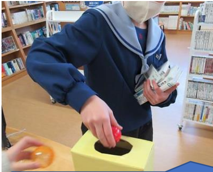
おみくじをひくため、毎日来館する人もいました。

新年の図書館イベント。本を借りると開運の1冊を教えてくれるおみくじがひけます。おみくじカプセルには「折り紙で作ったダルマしおり」や「週末だけコミックが借りられる券」がセットで入っていて、ダルマには自分で目を入れることができます。