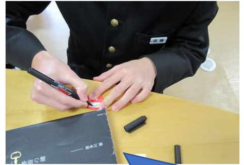
十人十色。さまざまな表情のダルマができました。