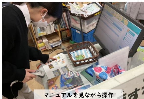
マニュアルを見ながら操作