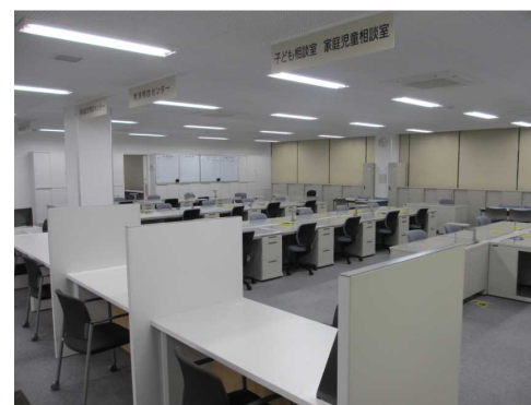
福祉総合相談センター 高齢者支援センター、発達相談センター、子ども相談室