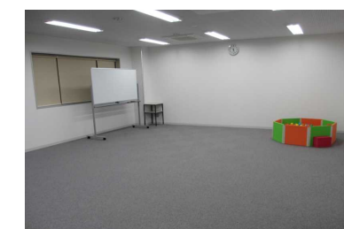
視聴覚室 ビデオ上映会等ができます