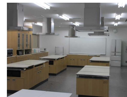
調理実習室・研修室 高さの調整できる台があります