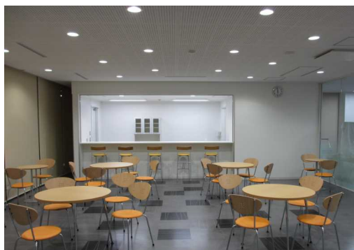
市社会福祉協議会