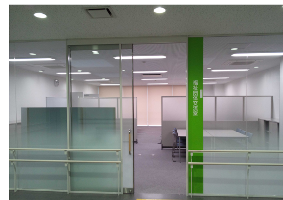
福祉団体交流室 福祉団体等の活動支援を行います