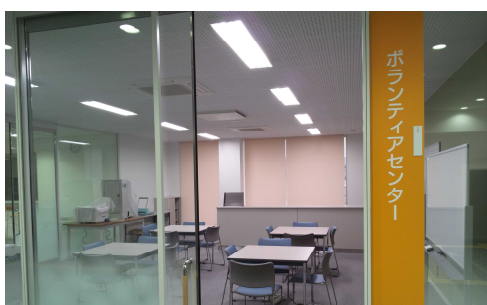
ふれあいコーナー