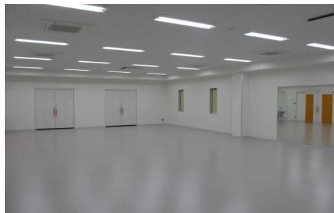
多目的ホール 介護予防訓練などを行います