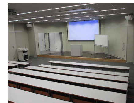
視聴覚室 ビデオ上映会等ができます