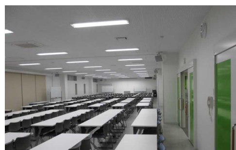
大・中・小会議室