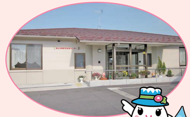
白山手取川ジオパークイメージキャラクター 「ゆきママとしずくちゃん」