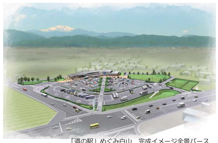
「道の駅」めぐみ白山 完成イメージ全景パース

主催：いしかわ「道の駅」フェス in 白山 実行委員会 (事務局：白山市 建設部 道の駅建設準備室)